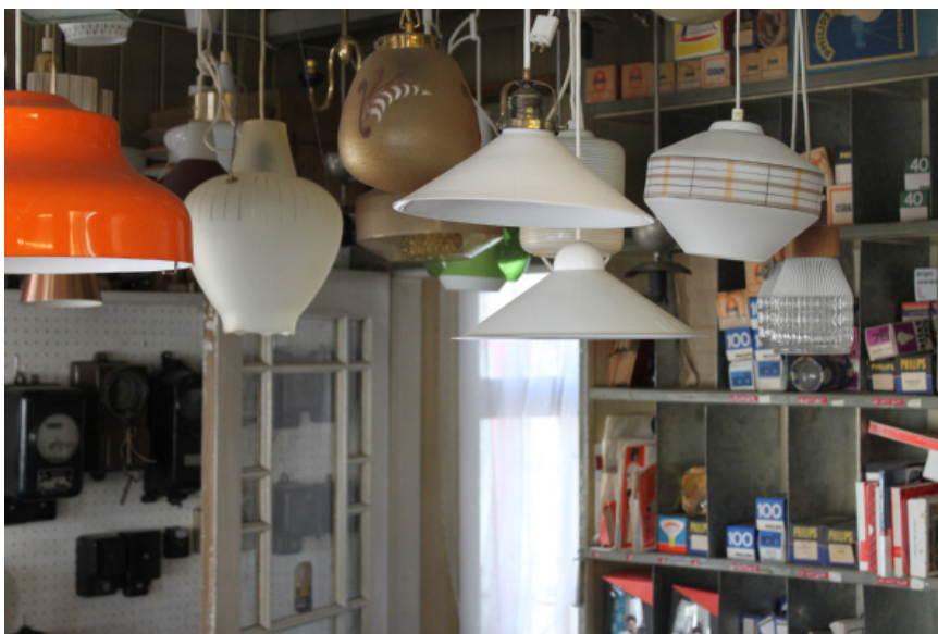
Alla fina lampor i taket i Gamla Elaffären