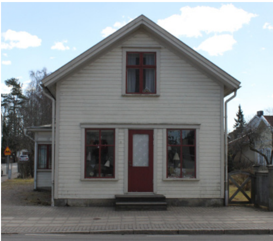
Den gamla elaffären på Storgatan, som i dag är som ett museum.