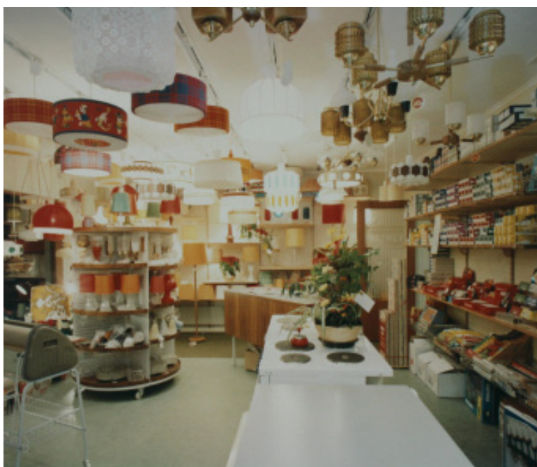
En interiör bild från nya elaffären. Färgbilden skapar en stark känsla för tiden, 1960-tal.